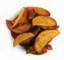
PAPA EN GAJO